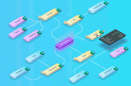
Gráfico HYCU R-Graph